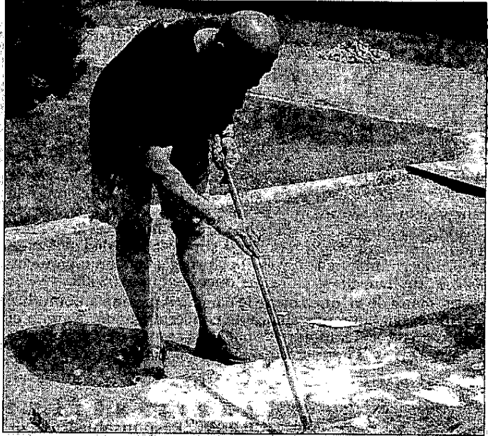
PEINTURES. Charles Christian Winslow a réalisé des œuvres sur place au château de la Chassaïne.

Le château de la Chassaïne accueille une seconde exposition cet été. Jean-Claude Herrera-Gutierrez présente, dans sa galerie personnelle, vingt-quatre peintures de Charles Christian Winslow jusqu'au 16 septembre.