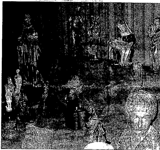
ENSEMBLE. Bois, pierre, bronze... Une collection de sculptures est marquée par la diversité des matières.

Pour l'antiquaire collectionner rime avec passion et c'est par là que vient la connaissance et la compétence. « Les experts ne sont pas toujours là où l'on croit qu'ils sont. Dans